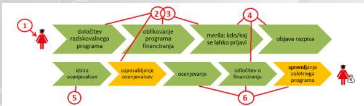
Slika 2: CHANGE-ovih šest vrst dobrih praks z vključeno enakostjo spolov v procesu financiranja raziskav

Kot je prikazano na sliki 2, določene vrste dobrih praks lahko zmanjšajo vrzeli v določenih fazah procesa financiranja raziskav. Poleg tega so le nekatere prakse namenjene individualni ravni raziskovalcev (zlasti tip št. 1), medtem ko se večina praks nanaša na institucionalno raven in širše. Zato je mogoče trditi, da lahko le izvajanje kombinacije praks vseh šestih tipov v vseh fazah procesa financiranja in na vseh sistemskih ravneh spodbudi celovito in trajnostno spremembo v smeri večje enakosti spolov in po spolu bolj uravnoteženega raziskovalnega okolja.